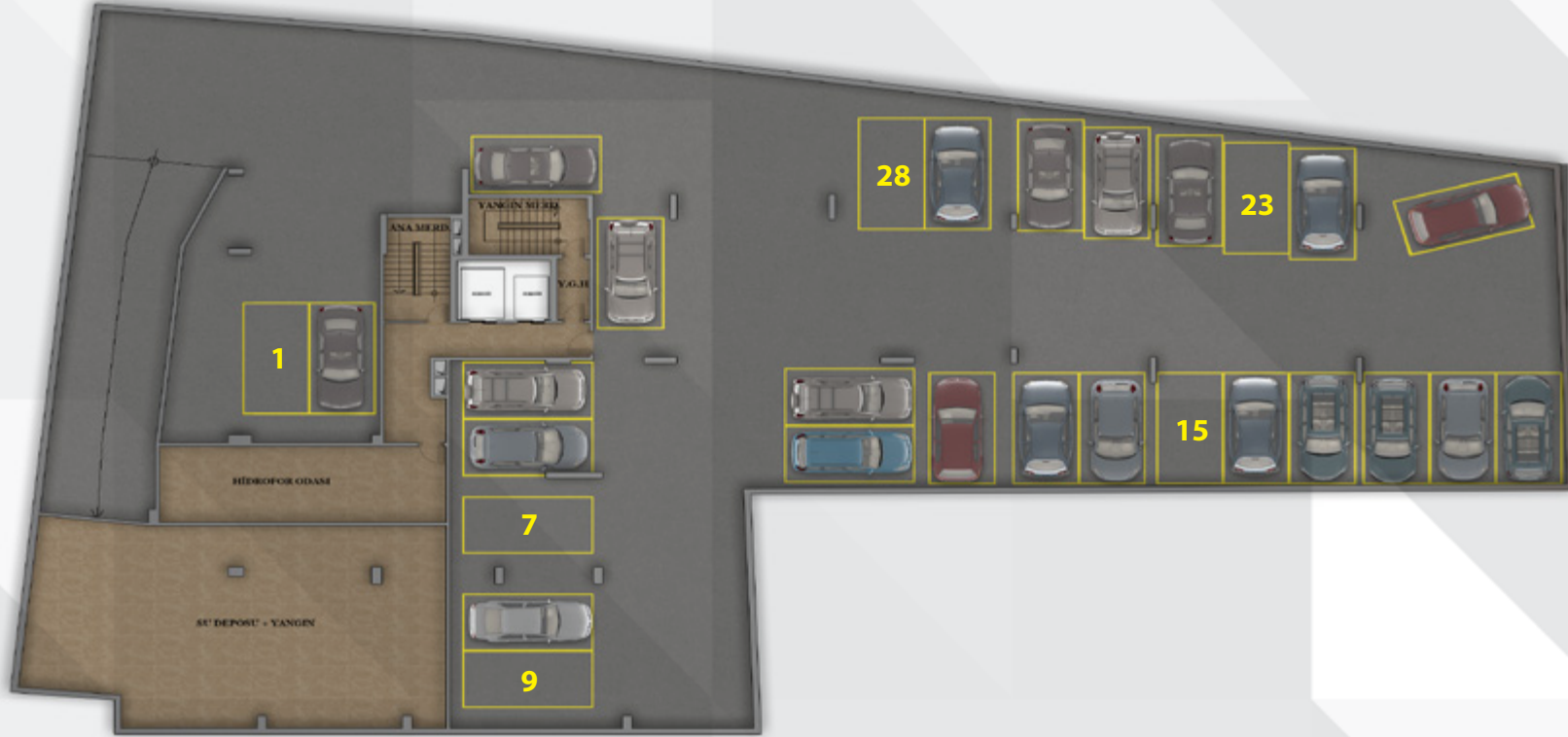
1. BODRUM KAT