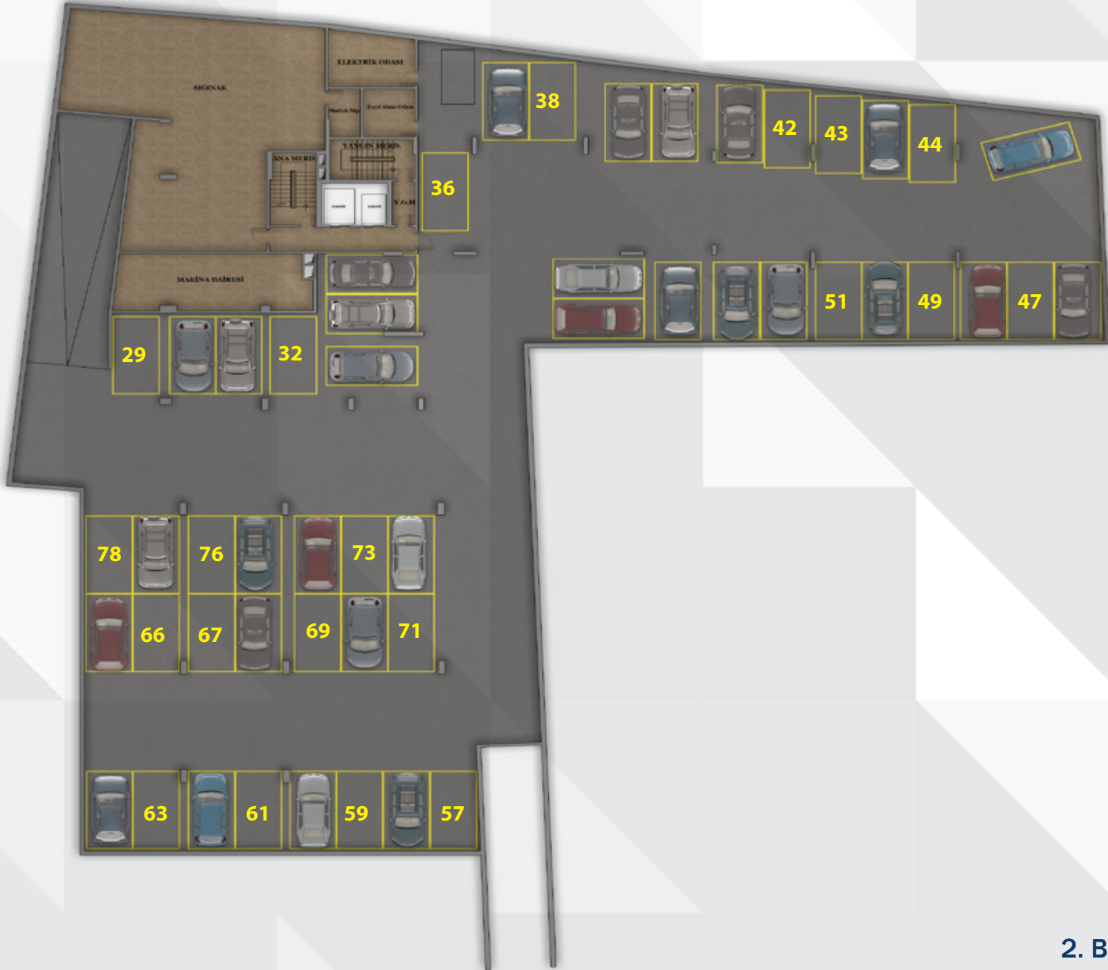
2. BODRUM KAT